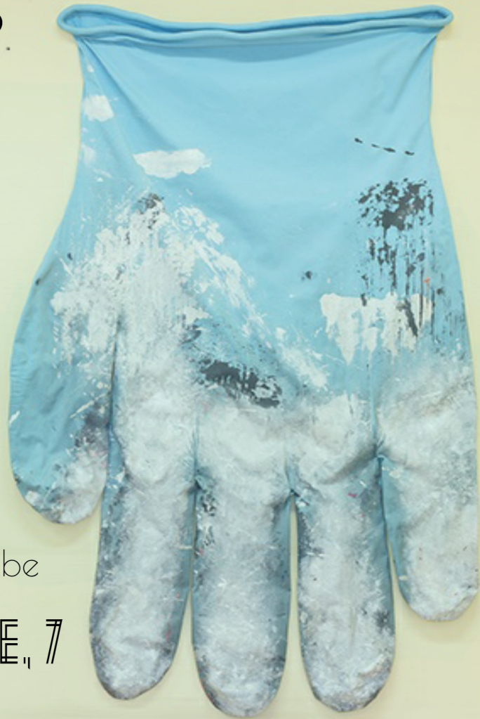
Blue Glover right 2 by Amanda Ross-Ho.

L'Expo « ECHO » est une initiative portée par une vingtaine d'organisations travaillant dans le secteur de la santé mentale à Bruxelles ainsi que des écoles qui proposent un projet artistique commun.