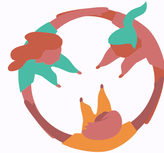
Le niveau émotionnel des familles

Les objectifs sont d'améliorer le confort personnel des familles et d'améliorer l'aide qu'elles peuvent apporter au malade, et d'aider ainsi indirectement le malade. Les séances du Programme où se réunissent une dizaine de participants sont animés par du personnel hospitalier ou extra-hospitalier tels que des infirmiers, des psychologues, des éducateurs, des familles et permettent d' apporter des connaissances sur la maladie et les traitements existants, de développer des habiletés relationnelles et une meilleure gestion des émotions . Un des objectifs du programme Profamille est de redévelopper chez les participants une capacité et une motivation à agir dans plusieurs domaines : par rapport à leur proche, par rapport à leur propre confort et leur vie personnelle, par rapport à la société et aux combats à mener pour que les troubles psychiatriques soient à l'avenir mieux traités.