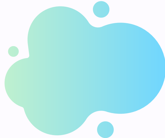
Les cognitions, c'est à dire les pensées